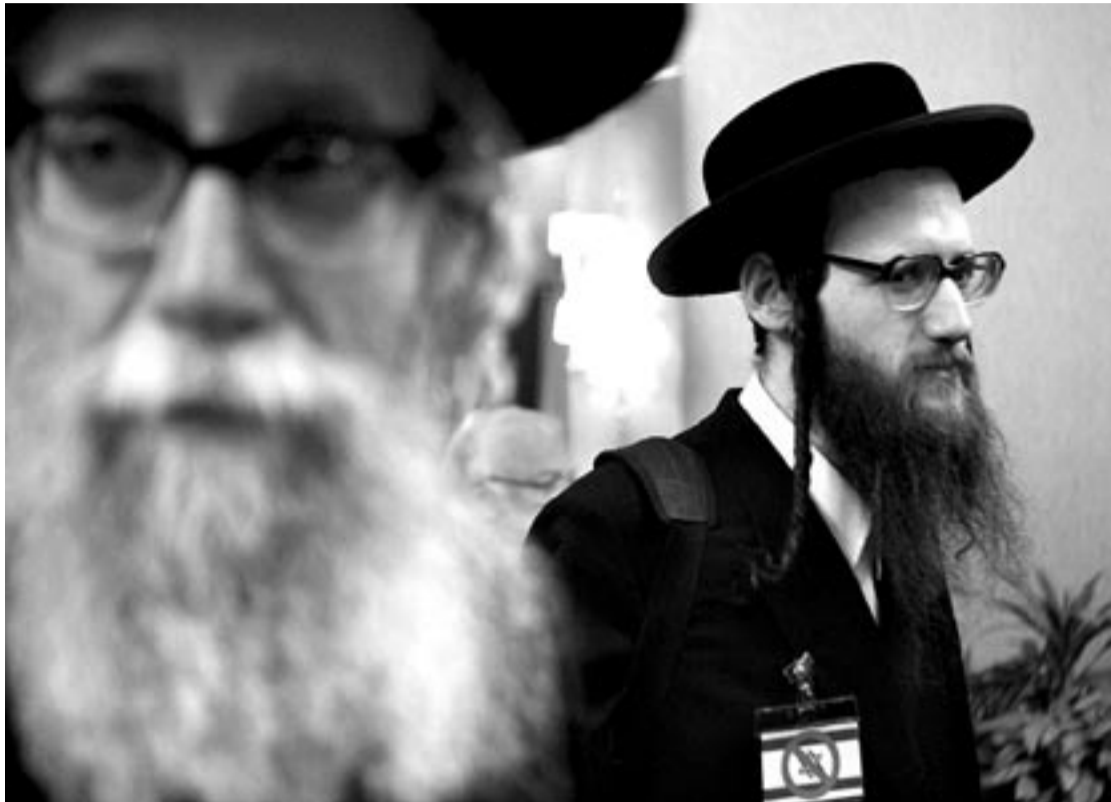
Varios judíos llegan al congreso sobre el Holocausto celebrado ayer, lunes 11 de diciembre, en el Ministerio de Asuntos Exteriores iraní en Teherán.

Desde ayer, 150 académicos se reúnen en Teherán bajo la teoría de que el Holocausto es un mito creado por la propaganda del sionismo internacional y que en Occidente no hay libertad para hablar del tema. En la apertura del coloquio, Manusher Muttaki, ministro iraní de Asuntos Exteriores, maquilló el encuentro, criticado en Occidente, al afirmar que "no se busca negar o confirmar el Holocausto, sino permitir que los intelectuales se expresen libremente sobre este asunto".