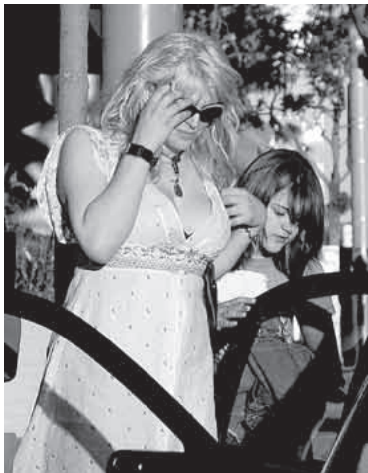
Courtney Love junto a su hija, Frances Bean Cobain.

▼ COURTNEY LOVE, LA ACTUACIÓN Y UNAS CÉLEBRES CENIZAS