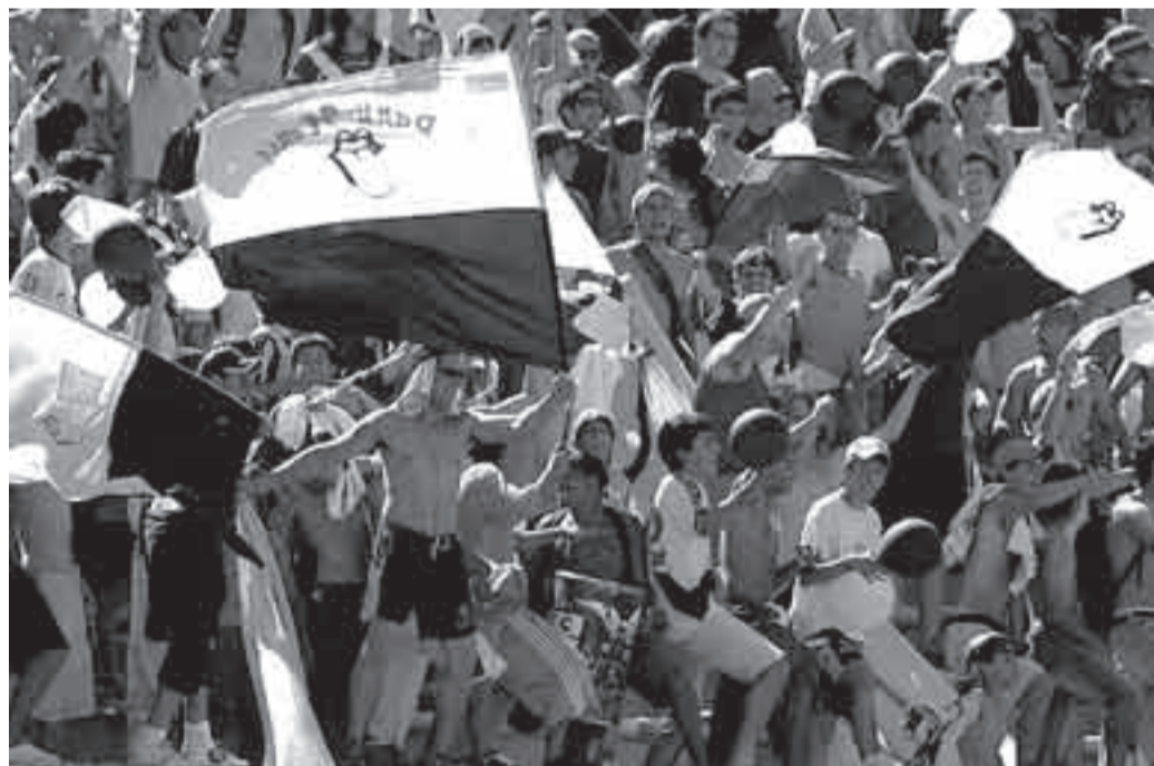
La hinchada de Danubio, el domingo en el Estadio.

Sucede que aquí en la diaria los floridenses somos la minoría mayoritaria, así que, guste o no, el insigne equipo de la Piedra Alta será el equipo de esta semana. Los floridenses tras una campaña histórica se consagraron como campeones nacionales de la categoría sub 15 en condición de invictos. Los dirigidos por el ex goleador Jorge Benoit fueron los máximos anotadores en el campeonato al marcar 41 goles en 14 partidos jugados. Los de la Piedra Alta también fueron los menos vencidos ya que sólo recibieron 8 goles en los 14 encuentros que lo condujeron al título. Florida ganó 12 partidos -el último fue la segunda final ante Cerro Largo a quien derrotó por 1 a 0 y 3 a 0 y sólo dejó por el camino 4 puntos producto de dos empates. ■