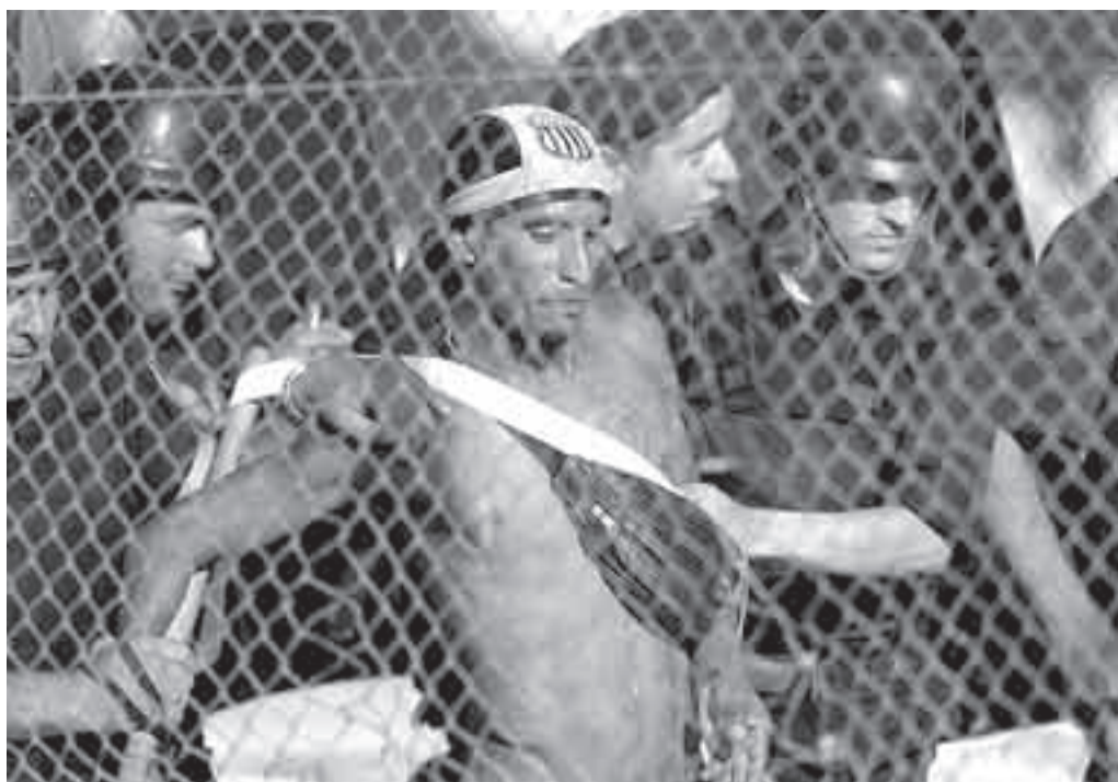
La policía retira a un hincha de Peñarol que había saltado al talud.

Las nuevas autoridades asumirán sus cargos seguramente en el correr de la próxima semana. ■